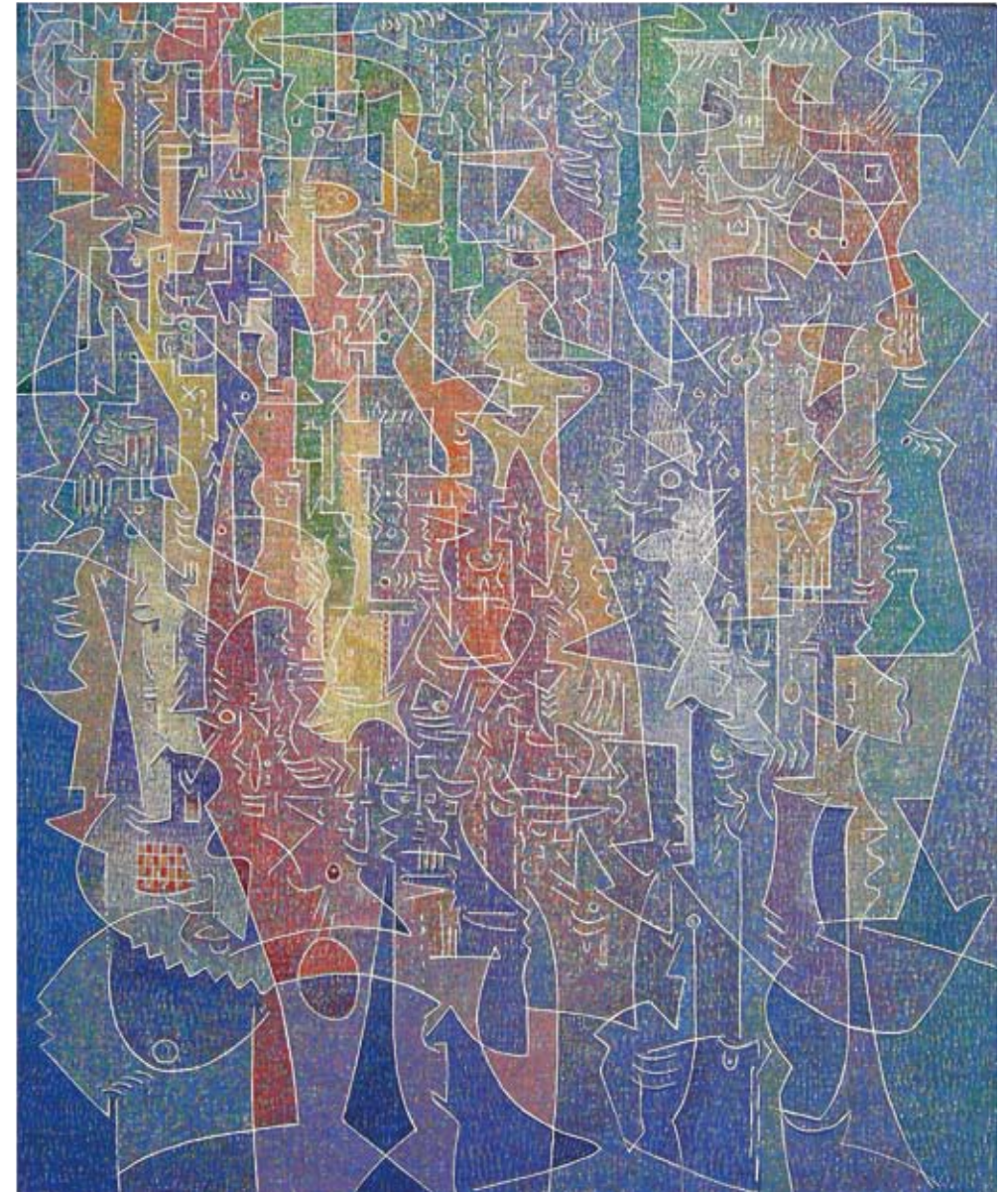
VINCENZO BALSAMO Linee di liberi pensieri, olio su tela, cm 80 x 65, 2000